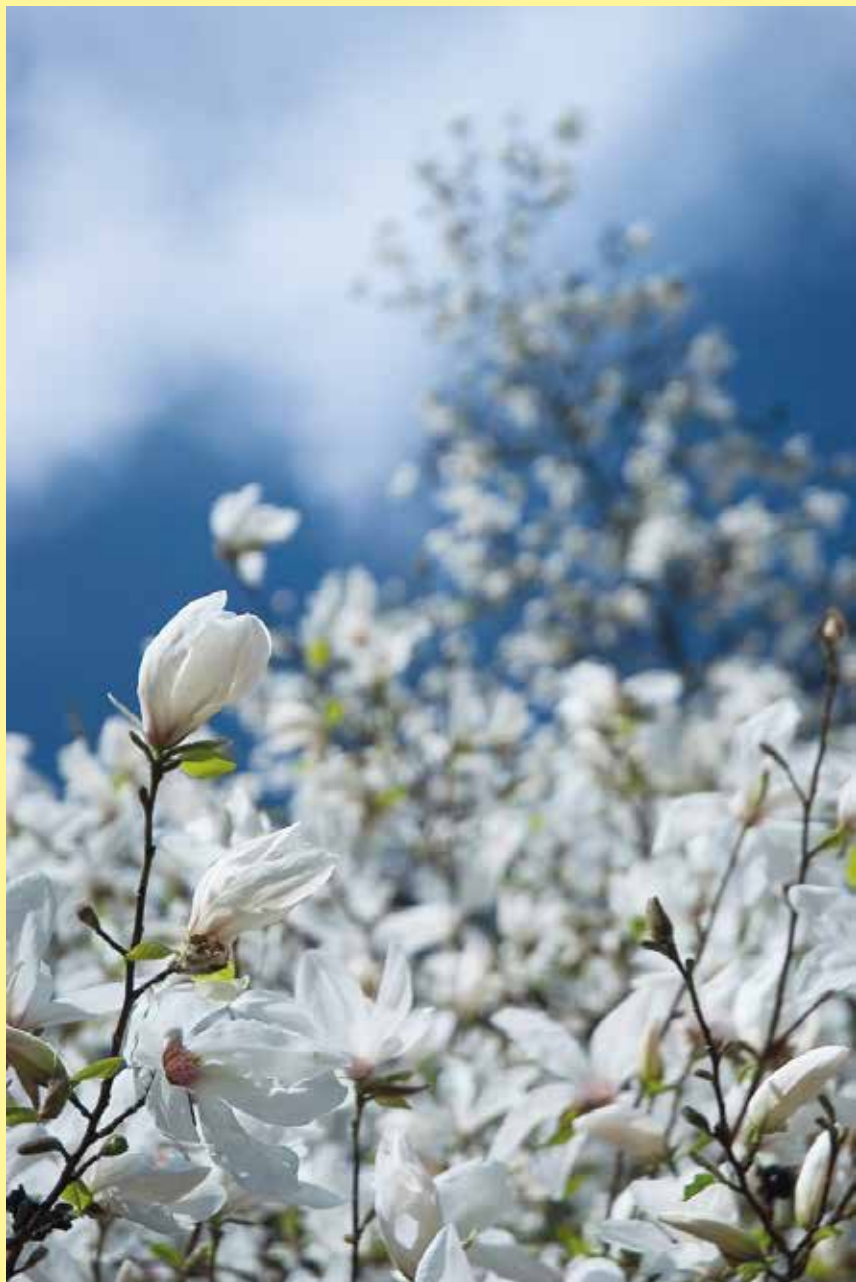
Terhes Árpád illusztrációja

Mert készültem hozzád, bensőm édes legyen.