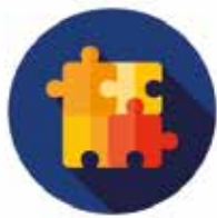
Hiventures befektetési tőkeprogramok bemutatása