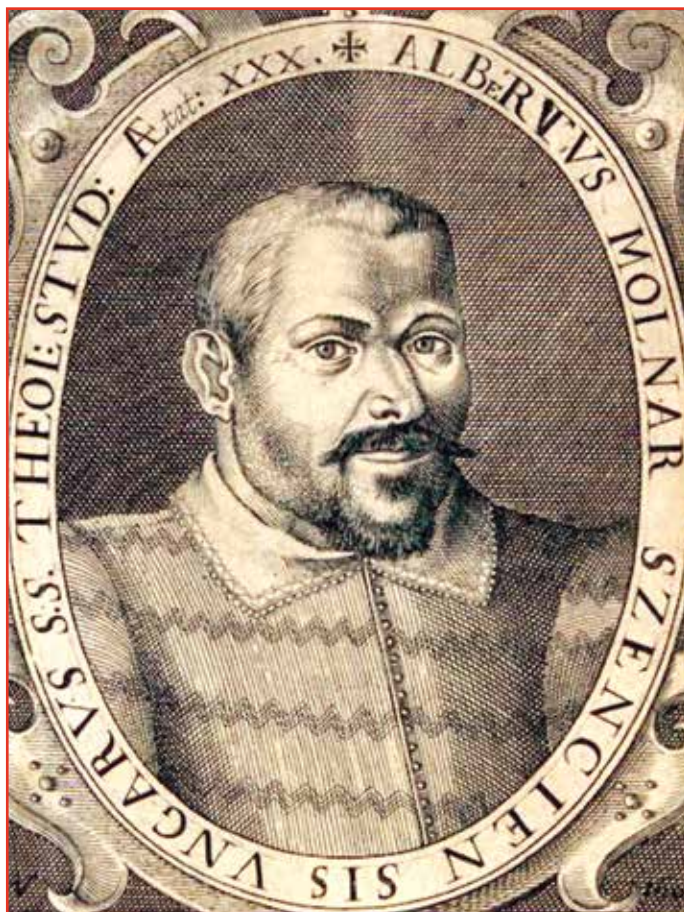
Heinrich Ulrich rézmetszete a harmincesztendős Szenci Molnár Albertről, 1604-ből